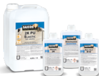
2K PU Elastic mit Zusätzen