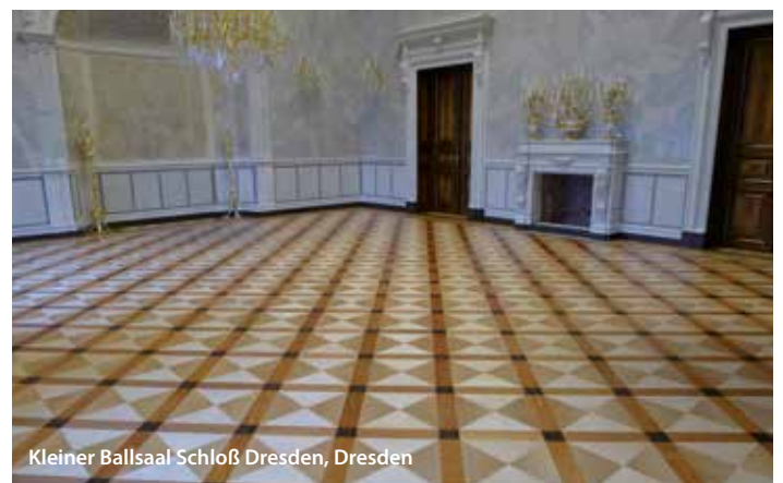
Kleiner Ballsaal Schloß Dresden, Dresden