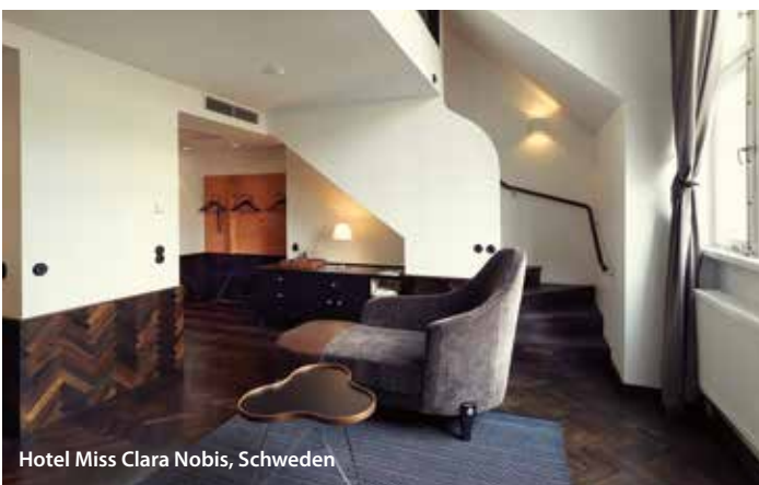
Hotel Miss Clara Nobis, Schweden