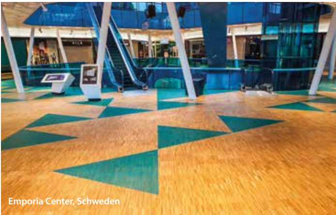
Emporia Center, Schweden