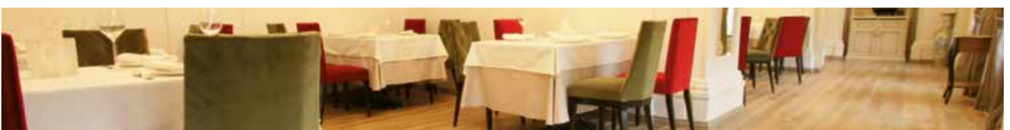
Restaurant Dom, Moskau - Russland