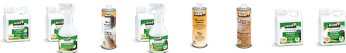
Ecoline Wischpflege Ecoline Magic Cleaner Wischpflege-Öl Ecoline Pflegewachs Pflegewachs Profi Pflege-Öl Ecoline Auffrischer Ecoline MultiTop Lack Polish