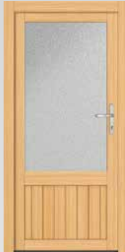
2/3 Verglasung Typ 22.4100H Basic U_p -Wert: <2,9 W/m 2 K