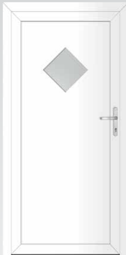
Typ 22.4400 A Basic