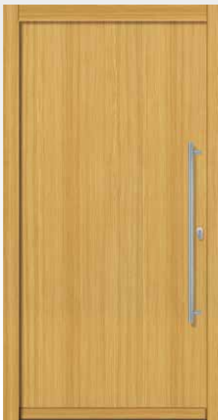
Typ 22.5800 H U d -Wert 1,1 W/m 2 K