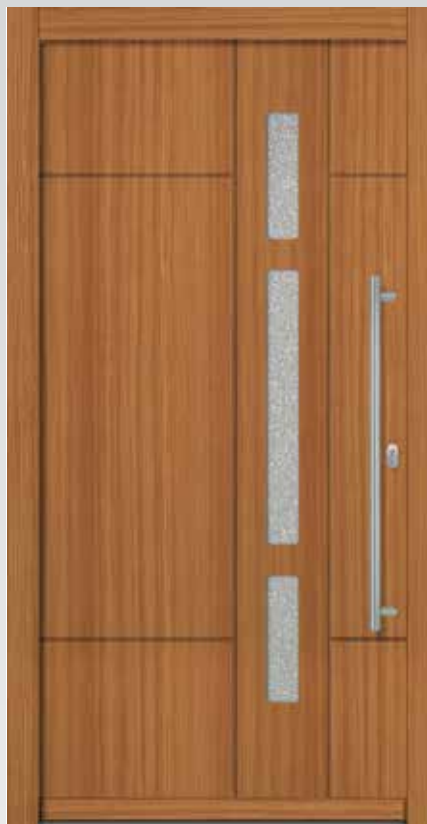
Typ 22.5600 H U d -Wert 1,2 W/m 2 K