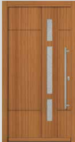
Typ 22.5600 H U g -Wert: 1,2 W/m 2 K