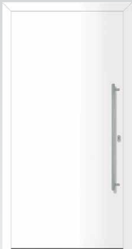
Typ 22.4700 A außen flügelüberdeckend U d -Wert 1,0 W/m 2 K

inklusive Edelstahl-Stoßgriff, Innendrückergarnitur und Profilzylinder