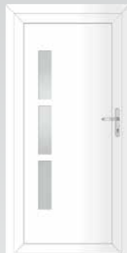
3 Lichtausschnitte Typ 22.4600 A Basic U_p -Wert: 1,3 W/m 2 K