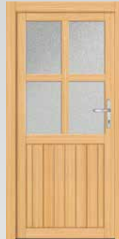
Kreuzsprosse Typ 22.4200H Basic U_p -Wert: <2,9 W/m 2 K