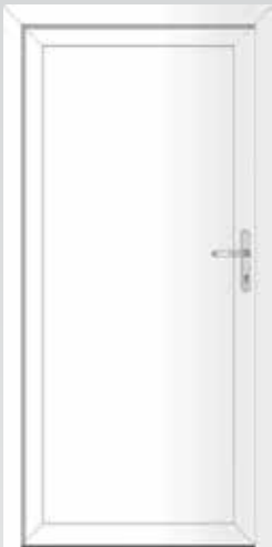
Geschlossene Füllung Typ 22.3500 K Basic U_D -Wert: 1,3 W/m 2 K

Millimetergenaue Anfertigung inklusive Drückergarnitur und Profilzylinder