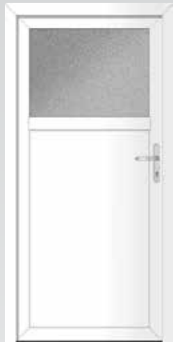
1/3 Glas oben Typ 22.3600 K Basic U_D -Wert: 1,4 W/m 2 K