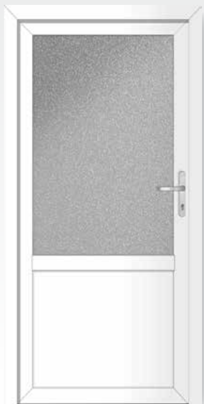
Typ 22.3700 K Basic