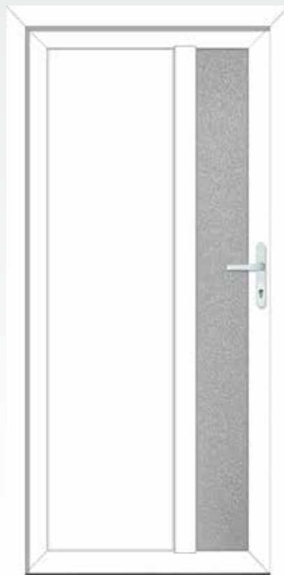
Typ 22.3800 K Basic