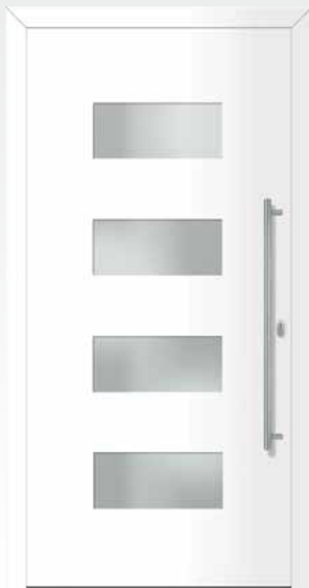
Typ 22.5000 A außen flügelüberdeckend U d -Wert 1,1 W/m 2 K