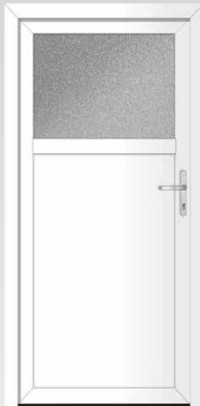
Typ 22.3600 K Basic