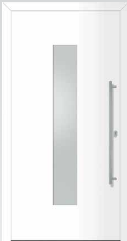
Typ 22.4800 A außen flügelüberdeckend U d -Wert 1,1 W/m 2 K