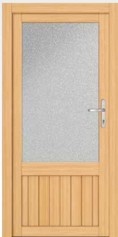
Typ 22.4100 H Basic