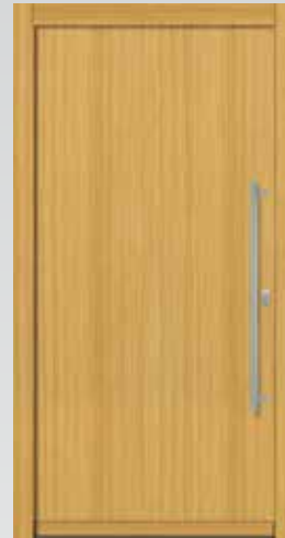
Typ 22.5800 H U g -Wert: 1,1 W/m 2 K