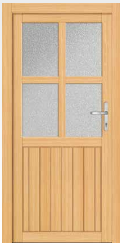
Typ 22.4200 H Basic