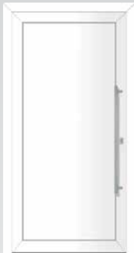
Geschlossene Füllung Typ 22.4701 A U_g -Wert: 1,1 W/m 2 K Einsatzfüllung

Millimetergenaue Anfertigung inkl. Edelstahl-Stoßgriff, Innendrückergarnitur und Profilzylinder