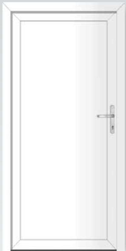
Typ 22.3500 K Basic

inklusive Drückergarnitur und Profilzylinder