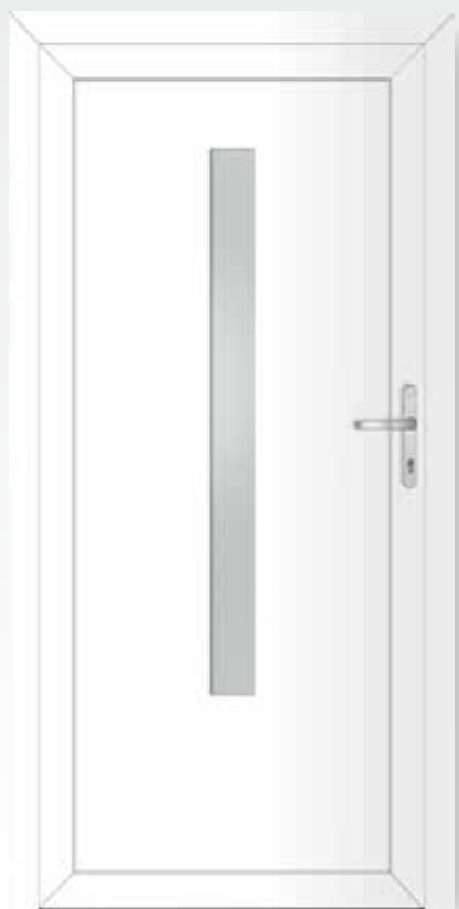
Typ 22.4500 A Basic