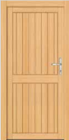
Geschlossene Füllung Typ 22.3900H Basic U_p -Wert: <2,9 W/m 2 K

Millimetergenaue Anfertigung inklusive Drückergarnitur und Profilzylinder