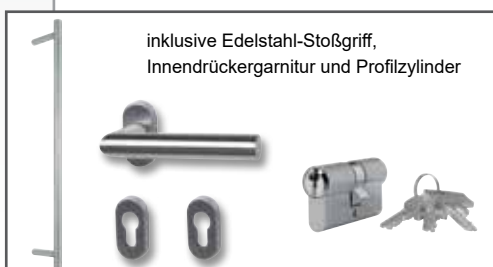
inklusive Edelstahl-Stoßgriff, Innendrückergarnitur und Profilzylinder