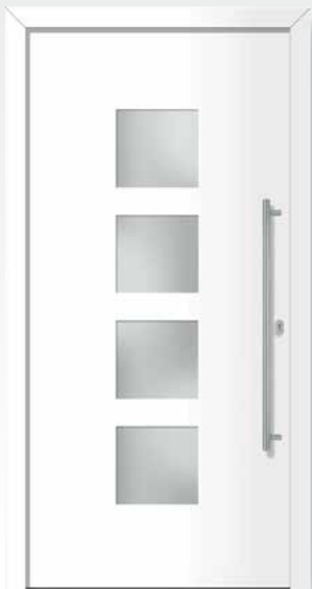
Typ 22.5300 K außen flügelüberdeckend U d -Wert 1,2 W/m 2 K