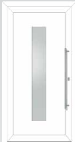
Langer Lichtausschnitt Typ 22.4801 A U_g -Wert: 1,2 W/m 2 K Einsatzfüllung