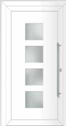
Lichtausschnitt 4 Quadrate Typ 22.4901 A U_g -Wert: 1,2 W/m 2 K Einsatzfüllung