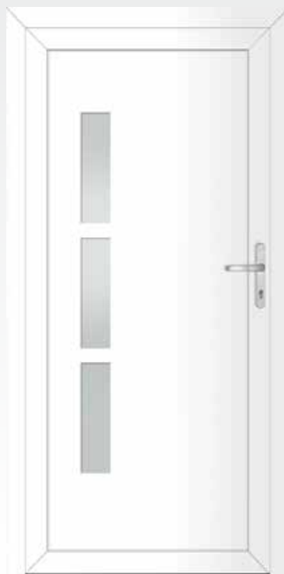
Typ 22.4600 A Basic