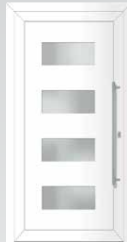
Lichtausschnitt 4 Rechtecke Typ 22.5001 A U_g -Wert: 1,2 W/m 2 K Einsatzfüllung