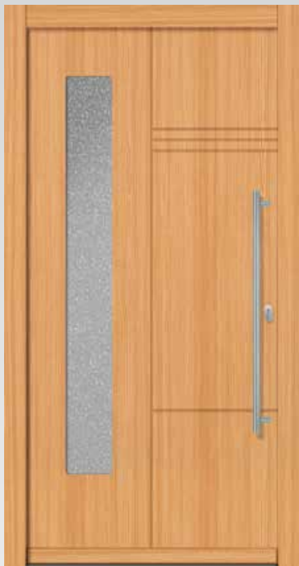
Typ 22.5500 H U d -Wert 1,2 W/m 2 K

inklusive Edelstahl-Stoßgriff, Innendrückergarnitur und Profilzylinder