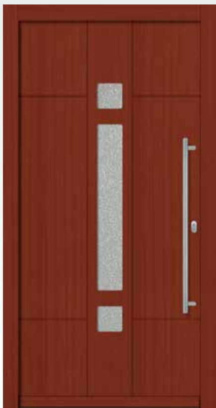
Typ 22.5700 H U d -Wert 1,2 W/m 2 K