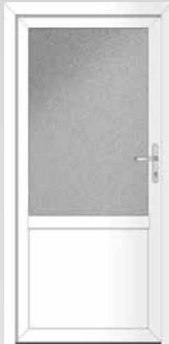
2/3 Glas oben Typ 22.3700 K Basic U_D -Wert: 1,4 W/m 2 K