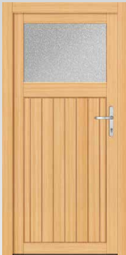
Typ 22.4000 H Basic