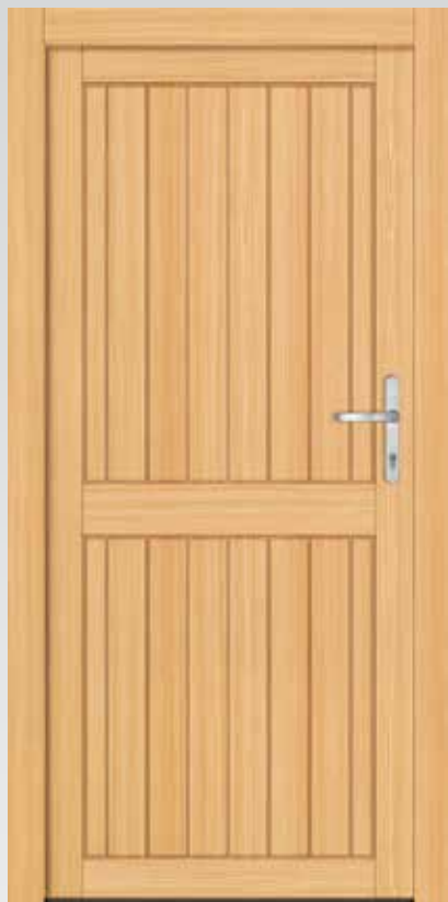
Typ 22.3900 H Basic

inklusive Drückergarnitur und Profilzylinder