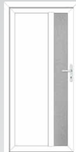
1/3 Glas seitlich Typ 22.3800 K Basic U_D -Wert: 1,3 W/m 2 K