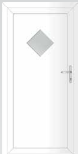
Raute Typ 22.4400 A Basic U_p -Wert: 1,3 W/m 2 K