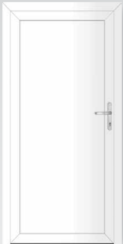
Typ 22.4300 A Basic

inklusive Drückergarnitur und Profilzylinder