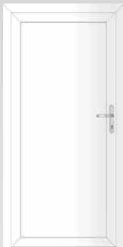
Geschlossene Füllung Typ 22.4300 A Basic U_p -Wert: 1,2 W/m 2 K

Millimetergenaue Anfertigung inklusive Drückergarnitur und Profilzylinder