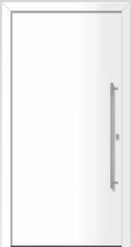
Typ 22.5100 K außen flügelüberdeckend U d -Wert 1,1 W/m 2 K

inklusive Edelstahl-Stoßgriff, Innendrückergarnitur und Profilzylinder