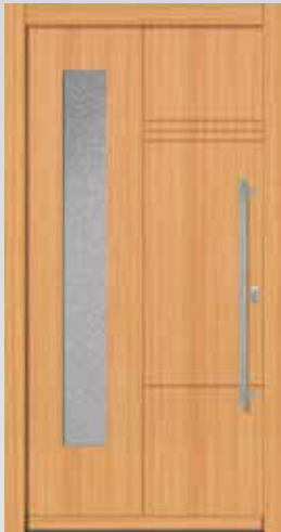
Typ 22.5500 H U g -Wert: 1,2 W/m 2 K

Millimetergenaue Anfertigung inkl. Edelstahl-Stoßgriff, Innendrückergarnitur und Profilzylinder