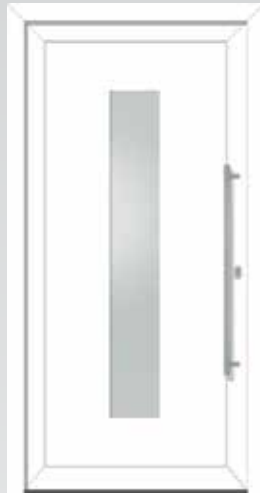
Langer Lichtausschnitt Typ 22.5201 K U_g -Wert: 1,4 W/m 2 K Einsatzfüllung