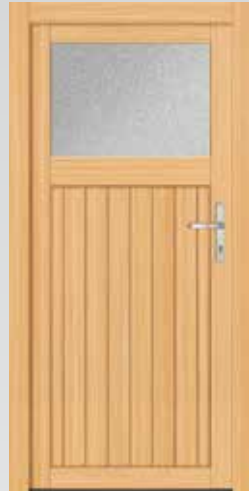
1/3 Verglasung Typ 22.4000H Basic U_p -Wert: <2,9 W/m 2 K