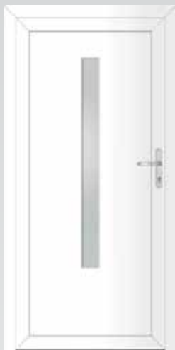
Langer Lichtausschnitt Typ 22.4500 A Basic U_p -Wert: 1,3 W/m 2 K