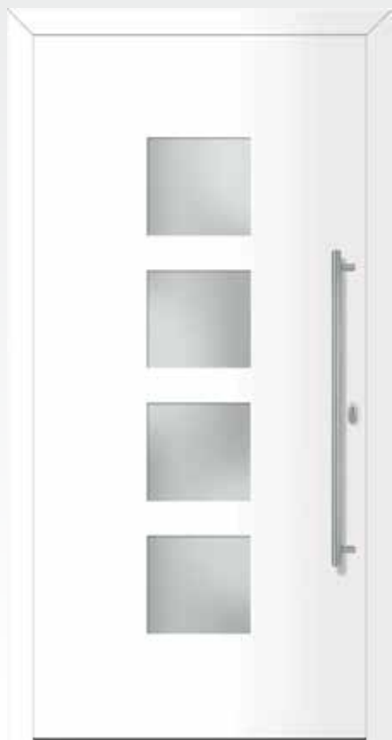
Typ 22.4900 A außen flügelüberdeckend U d -Wert 1,1 W/m 2 K