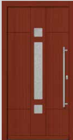
Typ 22.5700 H U g -Wert: 1,2 W/m 2 K