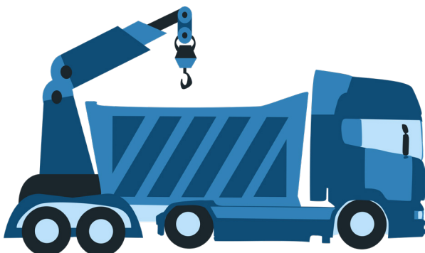
Großer Kran 2 Mercedes 26t.