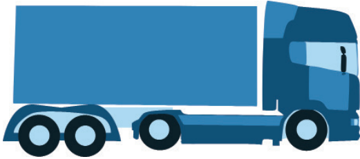
Planwagen 7 Mercedes 12t.