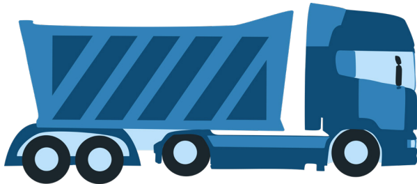
Kipper 5 MAN 18t.