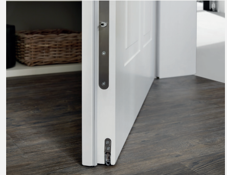
Bodendichtung für optimalen Schallschutz