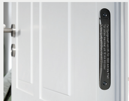
Belegte Qualität Kennzeichnung durch Prüfplaketten